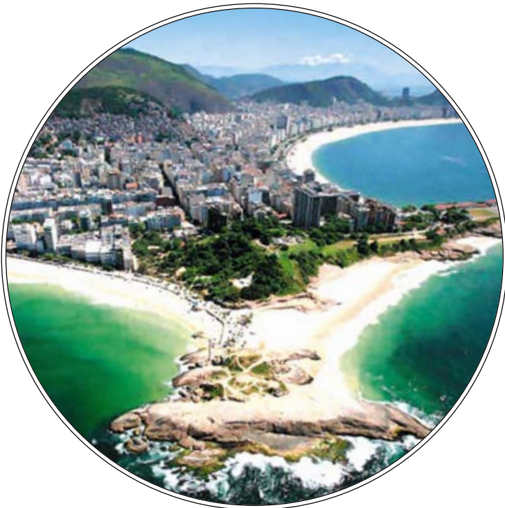
Рио-де-Жанейро: город-легенда. С 1565 года этот Cidade Maravilhosa, Изумительный Город, привлекает любителей красивой жизни со всего мира.

Остап Бендер, почетный гражданин Юга России, грезил этим мегаполисом Южного полушария. Карнавал. Футбол. Кофе. Фазенда. Это знают все. Казалось, Бразилия – недостижимая мечта, а оказалось, что двадцатичасовой авиаперелет на край света – это самая дорогая часть бюджета поездки. Рио впечатляет размахом уже из иллюминатора. Три зеленые горы взмывают из морской пены. Corcovado коронована самой большой статуей Христа на Земле. На фуникулерах к Pao de Asucar снимался фильм о Джеймсе Бонде. С Dois Irmaos бросаются самые отчаянные дельта-планеристы. А меж этих пиков помещаются целые миры: колониальные дворцы и причудливые небоскребы, скоростное метро и бездорожье, глянец элитных кварталов и безысходность фавел – одного из беднейших мест в мире. Курорт, деловой центр, культурная столица – у Рио множество ролей, и все главные!